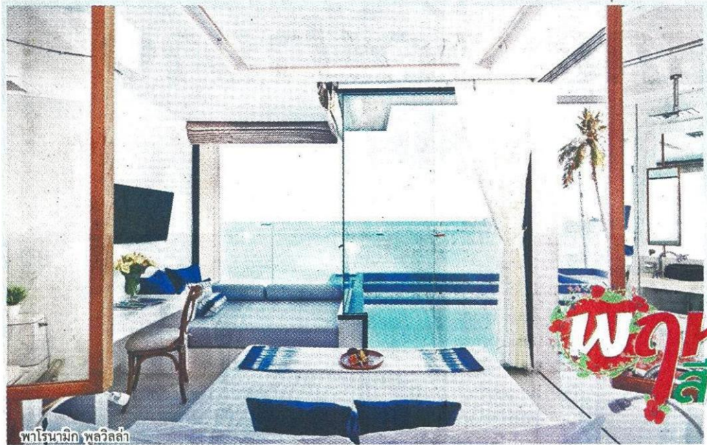
พาโนรามิก พูลวิลล่า

"อยากจะขอหยุดเวลาไว้สักหน่อย" เป็นความคิดแรกเมื่อแรกก้าวเข้ามาที่เห็นวิวของอ่าวยอนต์ ต.วิชิต อ.เมือง จ.ภูเก็ต ภายในห้องพัก หลังจากเดินทางมาจากกรุงเทพฯ ตั้งแต่เช้าตรู่และไม่คาดคิดว่าพื้นที่จุดหมายปลายทางแห่งนี้จะมีมนต์เสน่ห์ในความนิ่งสงบอย่างล้นเหลือ ภาพหาดทรายขาวโผล่ไล่ขึ้นไปเจอท้องทะเลสีฟ้าอ่อนไปเข้มและอ่อนลงเมื่อประกบกับสีท้องฟ้าตรงหน้าทำให้ต้อง "หยุด" คิดและการกระทำทุกอย่างเพื่อชื่นชม นั่นคือสัญญาณแรกของชีวิตใหม่ๆ อันคาดไม่ถึงว่าจะเกิดขึ้นได้กับคนเมืองที่ไม่เคยอยู่เฉยได้แต่เป็นไปแล้วที่ปัญญาธา รีสอร์ท ภูเก็ต อันขึ้นชื่อว่าเป็นสวรรค์