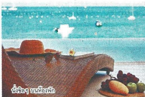
นั่งชิลๆ บนห้องพัก

"อยากจะขอหยุดเวลาไว้สักหน่อย" เป็นความคิดแรกเมื่อแรกก้าวเข้ามาที่เห็นวิวของอ่าวยอนต์ ต.วิชิต อ.เมือง จ.ภูเก็ต ภายในห้องพัก หลังจากเดินทางมาจากกรุงเทพฯ ตั้งแต่เช้าตรู่และไม่คาดคิดว่าพื้นที่จุดหมายปลายทางแห่งนี้จะมีมนต์เสน่ห์ในความนิ่งสงบอย่างล้นเหลือ ภาพหาดทรายขาวโผล่ไล่ขึ้นไปเจอท้องทะเลสีฟ้าอ่อนไปเข้มและอ่อนลงเมื่อประกบกับสีท้องฟ้าตรงหน้าทำให้ต้อง "หยุด" คิดและการกระทำทุกอย่างเพื่อชื่นชม นั่นคือสัญญาณแรกของชีวิตใหม่ๆ อันคาดไม่ถึงว่าจะเกิดขึ้นได้กับคนเมืองที่ไม่เคยอยู่เฉยได้แต่เป็นไปแล้วที่ปัญญาธา รีสอร์ท ภูเก็ต อันขึ้นชื่อว่าเป็นสวรรค์