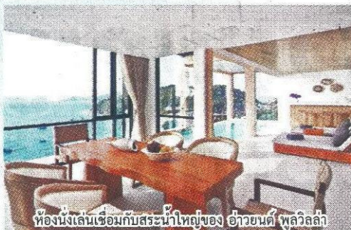
ห้องนั่งเล่นเชื่อมกับสระว่ายน้ำใหญ่ของ อ่าวยนต์ ภูเก็ต

นอกจากความประทับใจในห้องพักแล้ว การเดินเล่นริมหาดที่นี่ยังทำให้แปลกใจนิดหน่อย เพราะโดยรอบนั้นไม่มีสถานบันเทิงคึกคักจะมีเพียงโรงเรียนสอนเล่นเรือใบ บ้านพักส่วนตัวของชาวต่างชาติ และที่พักของชาวบ้านดั้งเดิมตั้งอยู่ในที่เดียวกันอย่างลงตัว และใช้วิถีชีวิตช้าๆ เรียบง่ายเหมือนกัน ช่วงเช้าอากาศดีหาดจะมีสีส้มบางคนไปออกเรือ นกท้องเขียวและชาวต่างชาติในพื้นที่จะมาวิ่งออกกำลังกาย ทักทายกันอย่างอบอุ่น ช่วงกลางวันจะเงียบสงบคลื่นลม